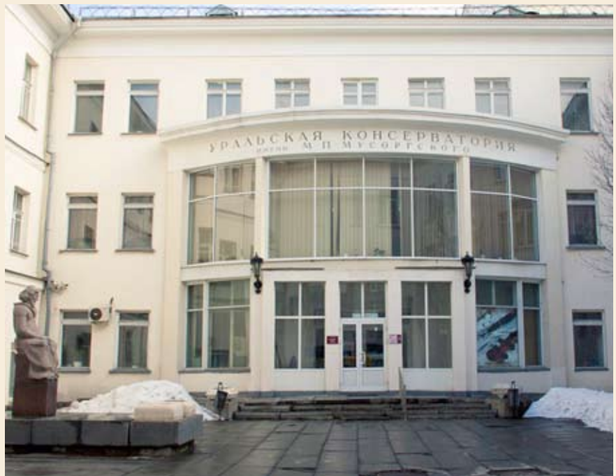
Уральская консерватория имени М.П. Мусоргского и памятник композитору

Всегда стоим за то, чтобы пробовать новое. Например, современная нотация. Запись сов-