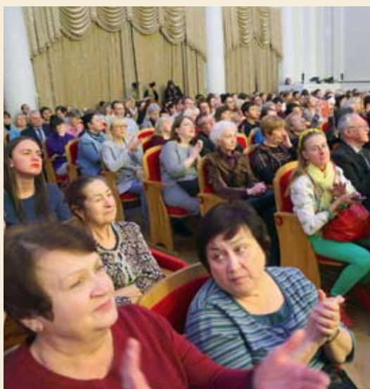
В зале — аншлаги