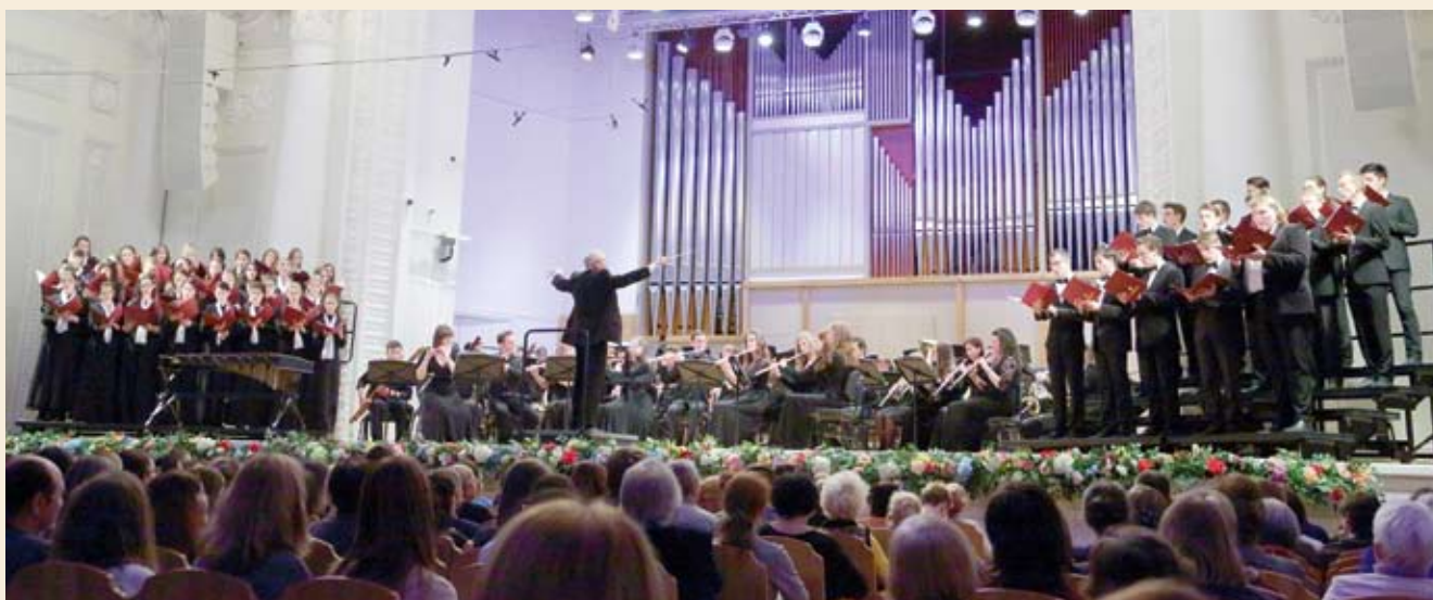
Оркестр духовых инструментов и смешанный хор студентов УГК